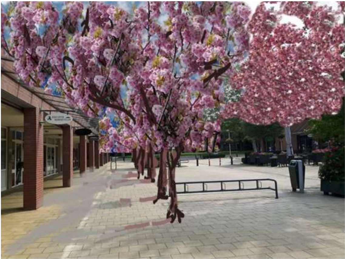
Hieronder: zomaar een straat in lentefeesttooi